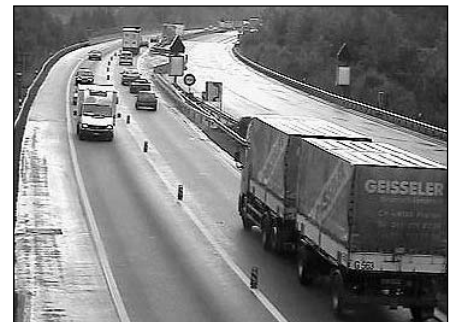
Internet-Kamera 1 km vor dem Tunnel Richtung Bern-Luzern

Seit der Schweizerhalle-Eintunnelung werden bzw. wurden speziell zwischen Augst und Basel Hunderte neuer Signale und Infotafeln montiert. Per 3. September durfte aufgrund von Verlautbarungen aus der BUD auch erwartet werden, dass dieses Verkehrsleit-System nun endlich in Betrieb genommen wird. Doch vorerst bleiben die Signal-Kaskaden grösstenteils «stumm» bzw. schwarz. Vereinzelt sind bis heute Informationen über «Probleme» mit der Software in die Öffentlichkeit getropft. Es wäre wünschenswert, wenn zu diesem Punkt seitens der Behörden ebenfalls etwas besser und offener informiert würde. ebo.